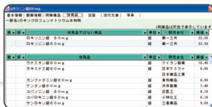
▲後発品の一発検索。