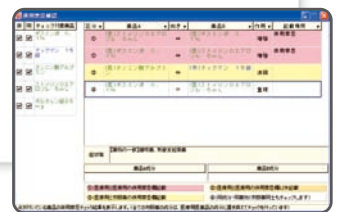
▲医療用、OTC の併用禁忌、重複投与チェック。